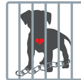
Penderitaan Hewan Yang Luar Biasa

Banyak di antara mereka yang mati karena lemas, dehidrasi, atau heatstroke, bahkan sebelum mencapai tempat tujuan. Bagi yang selamat, mereka akan menyaksikan teman-teman mereka dibunuh secara brutal di rumah jagal yang kotor, sambil menunggu giliran mereka. Ketakutan mereka tentu tidak terbayangkan.