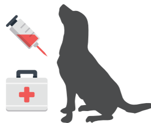
Vaksinasi anjing massal akan membantu mengeliminasi virus fatal tersebut